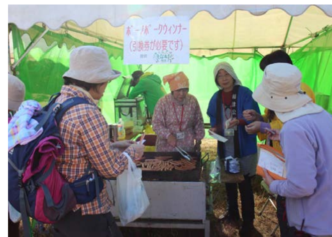
ゴール後にはウィンナーと豚汁が振る舞われました