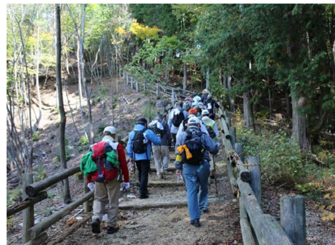
里山の自然を満喫できる遊歩道