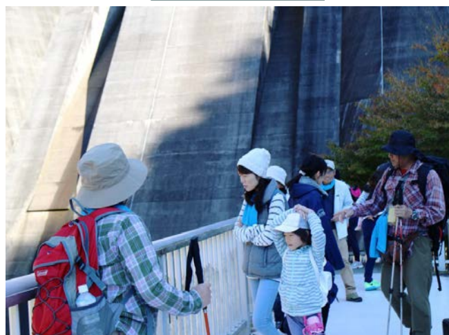
ウォーキングの途中にダム見学