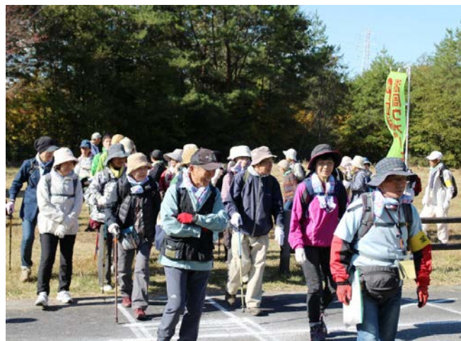
勢いよくスタート!